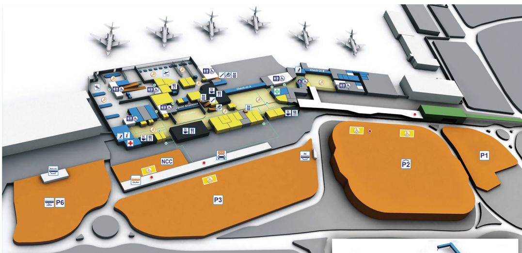
PLANIMETRIA GENERALE_PIANO TERRA External Layout_Ground Floor